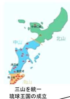
尚巴志による琉球王国統一の足跡をたどる旅